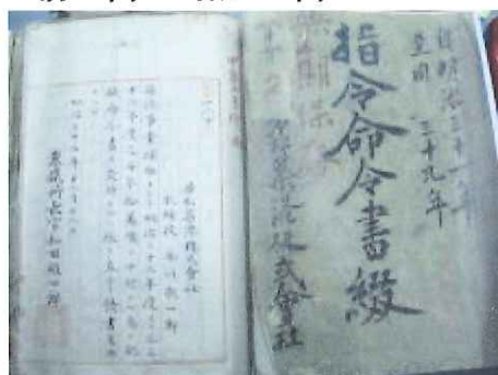
明治32年製鐵所長官よりの命令書