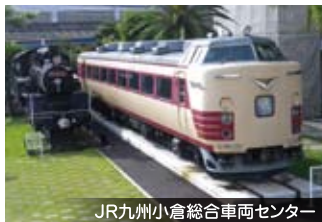
JR九州小倉総合車両センター

クルーズトレイン「ななつ星 in九州」や特急列車「ソニック」などの整備等を担うJR九州小倉総合車両センターへ。タイミングが合えば、「ゆふいんの森」などD&S列車に出会えるかも。午後からは、日本を代表する自動車メーカー日産自動車九州で迫力ある車づくりの見学と北九州市民の足代わりとして長年支えてきた北九州モノレールの整備工場をご案内。昼食は、冬の牡蠣小屋でお馴染みの「はちがめ」にて豪快! 漁師飯を堪能して頂きます。