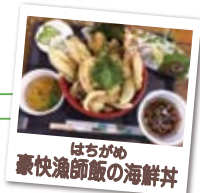
はちがめ 豪快漁師飯の海鮮丼

[9:10]小倉駅新幹線口=JR九州小倉総合車両センター =牡蠣小屋はちがめ(昼食)=モノレール総合基地見学= 日産自動車九州工場見学=[17:00頃]小倉駅新幹線口